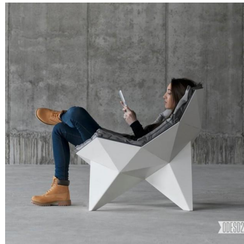
صورة رقم " 1 " توضح قطع اثاث بخطوط اختزالية لمصمم RON ARAD