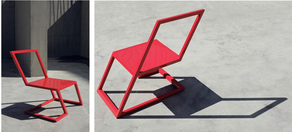
صورة رقم " 18 " توضح القيمة الجمالية لكرسي به ازاحة للكتلة والخط