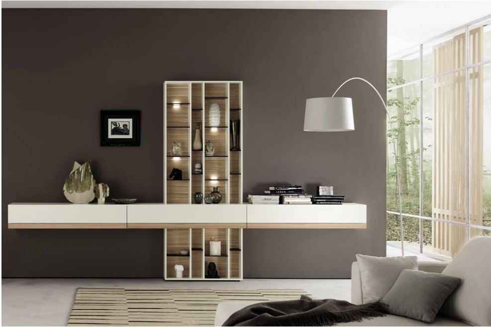
صورة رقم " 8 " توضح القيم الجمالية بين الخطوط الراسية والافقية التي استخدمها المصمم في تناغم بالاشكال الهندسية