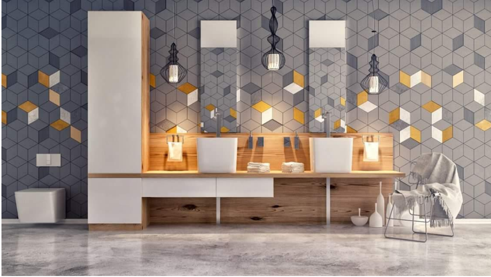
صورة رقم "17" توضح تصميم حائط رأسي لحمام باستخدام الخطوط الهندسية البسيطة والتوزيع المدروس بالألوان