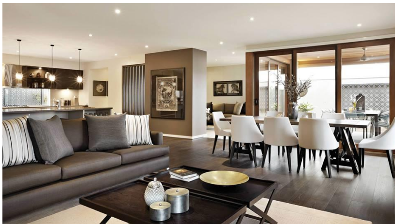
صورة رقم " 4 " توضح القيمة الجمالية للتصميم البسيط واستخدام الخطة اللونية الاحادية