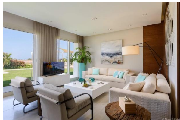
صورة رقم " 15 " إحدى الفيئات بالقاهرة الجديدة توضح الاثاث البسيط باستخدام الخامات الحديثة التي تلائم اشكال الاثاث الاختزالي