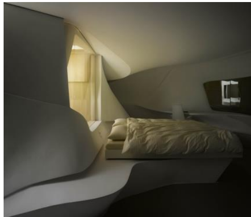
صورة رقم " 6 " توضح انسيابية التصميم والخط المنحني المستمر وجمال العلاقة بين التصميم الداخلي وتصميم الاثاث - من تصميم زها حديد.

ومن خلال تطبيق مبدأ الاختزال وسماته في التصميم يستطيع المصمم الداخلي التحكم في المساحات الداخلية للفراغ، وتحقيق كافة المتطلبات الوظيفية والجمالية بها من خلال البساطة في معالجة عناصر الفراغ الداخلي من ارضيات وحوائط وأسقف وذلك عن طريق الاختيار المناسب للألوان والاضاءة والخامات وعناصر الاثاث الداخلية وتكاملهم في تصميم يتسم بالجمال الشكلي والاختزال والقدرة على الأداء الوظيفي. كما ان دراسة التأثيرات الضوئية التي تسقط على كل من الفراغ واللون جزء اساسي من خبرة المصمم، فالضوء والحركة يعتبران في حد ذاتهما بمثابة ارضية لعملية التصميم كما موضح بالصورة رقم " 6 "، والضوء له اهمية كبيرة في تشكيل الفراغ الداخلي الاختزالي (1 - ص 95).