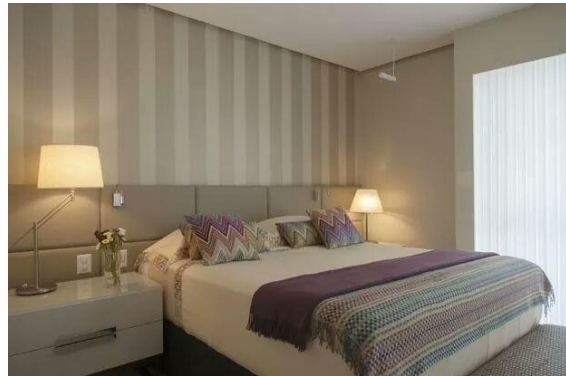
صورة رقم " 14 " تصميم يوضح اهمية استخدام اللون في التصميم لتوضيح والتاكيد على الفراغ الداخلي بفكر فلسفي اختزالي

اتجاه جمهورية مصر العربية لانشاء مدن جديدة تحتوي علي وحدات سكنية بمساحات مختلفة واتجاه الفكر الحديث للاختزال في التصميم والذي يعتمد علي بساطة الخطوط واهمية اللون والبعد عن التفاصيل الزخرفية مع الحفاظ علي الوظيفة والشكل الجمالي بحيث يضي اتساعا علي الفراغ بالتصميم الداخلي للمساحات الصغيرة ، فان فلسفة الفكر الاختزالي هو من اكثر الاتجاهات التصميمية التي تنقل الاحساس باتساع الفراغ الداخلي ، كما تعد مرونة التقسيم المرن للفراغ التي يتميز بها المذهب الاختزالي من اهم العوامل التي يجب مراعاتها لتقديم مساحة صغيرة بحل عملي .