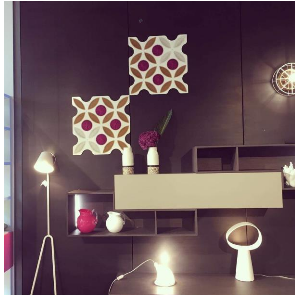
صورة رقم " 3 " توضح تكوين لمكتبة بالاسلوب الاختزالي الذي يعد أكثر ملائمة في التصميم لغرف المعيشة