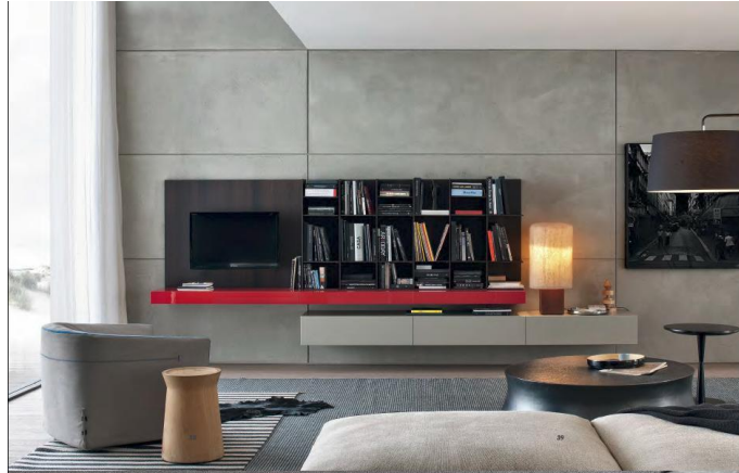
صورة رقم " 11 " توضح الاتجاه نحو البساطة والتجريد الي ايسط الاشكال الهندسية والي اقل الخطوط والمساحات

كما تميزت العمارة المعاصرة بالاتجاه نحو البساطة وحذف كل ما هو زائد والتجريد الي ايسط الاشكال الهندسية والي اقل الخطوط والمساحات، واطهرت التكنولوجيا خامات حديثة مما كان له دورا في ظهور العمارة الحديثة البسيطة الخالية من الزخارف وبالتالي تطور صناعة الاثاث بتصميمات أكثر بساطة كما موضح بالصورة رقم " 11، 12 " .