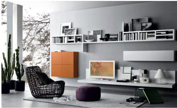
صورة رقم " 12 " توضح الاعتماد على التجريد والبساطة في شكل واستخدام اللون بشكل مناسب للتصميم

كما تميزت العمارة المعاصرة بالاتجاه نحو البساطة وحذف كل ما هو زائد والتجريد الي ايسط الاشكال الهندسية والي اقل الخطوط والمساحات، واطهرت التكنولوجيا خامات حديثة مما كان له دورا في ظهور العمارة الحديثة البسيطة الخالية من الزخارف وبالتالي تطور صناعة الاثاث بتصميمات أكثر بساطة كما موضح بالصورة رقم " 11، 12 " .