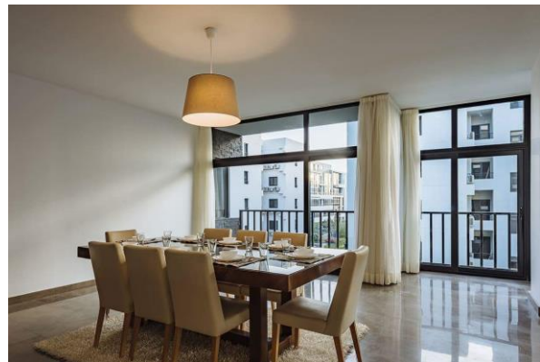
صورة رقم " 13 " توضح التصميم الداخلي البسيط الخالي من الزخرفة لاحدي الوحدات السكنية بالقاهرة الجديدة