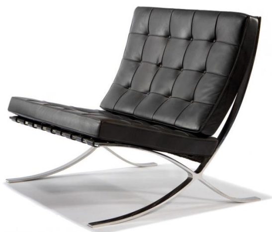
صورة رقم (10) توضح مقعد من تصميم ميس فان دروه

فلسفة الاختزالية من الباوهاوس خاصة من الاتجاه النقائي الذي اتبعه " ميس فان دروه " والذي قامت عليه فلسفة التصميمات المعمارية والتصميم الداخلي والآثاث كما موضح بصورة رقم " 10 "، وقد يري البعض في التصميم الداخلي الاختزالي نوعا من العدم والفراغ، بينما الاختزاليون فلسفتهم قائمة على التقليل وعدم تراكم عناصر الفراغ الداخلي من الآثاث وزخارف في الحوائط، وذلك لاطهار القيم الجمالية بالتصميم الداخلي من ملامس والوان ونسب الفراغ ويمكن تفسير ذلك بتعريف جديد للجمال (4 - ص 302).