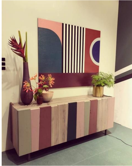
صورة رقم " 2 " توضح وحدة تخزين تتميز بالشكل الهندسي والخطوط المستقيمة