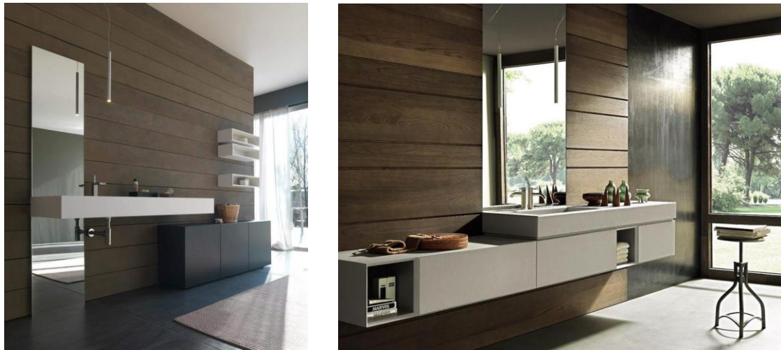
صورة رقم " 19 " توضح وحدة حمام بخط اختزالي هندسي بخطوط مستقيمة رأسية وافقية في تناغم مع الخطوط المستخدمة كخلفية للوحدة