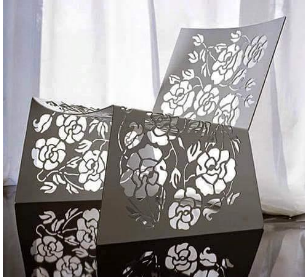
صورة رقم " 7 " توضح تصميم لكرسي ووحدات انتظار من اللدائن بفكر اختزالي بسيط – تصميم مجموعة الكيبي.