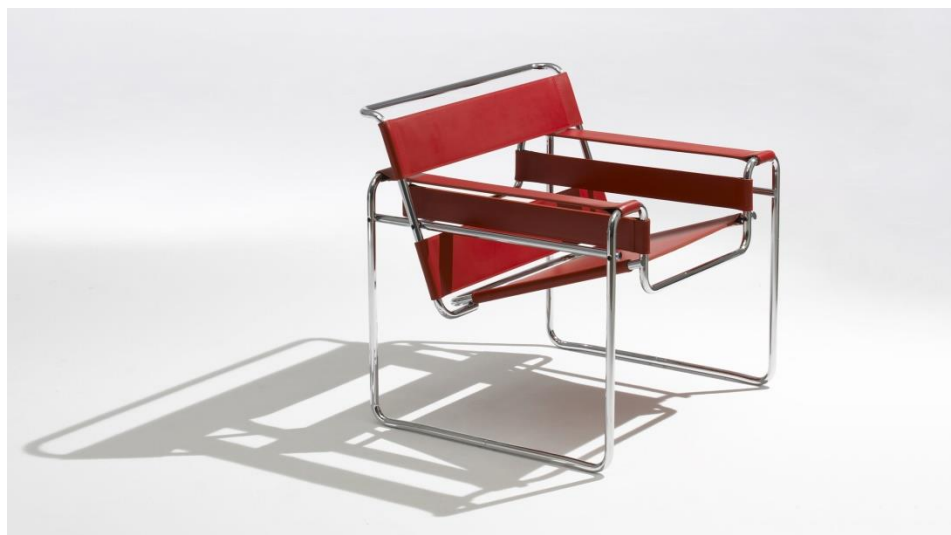
صورة رقم (9) توضح مقعد من تصميم مارسيل بروير