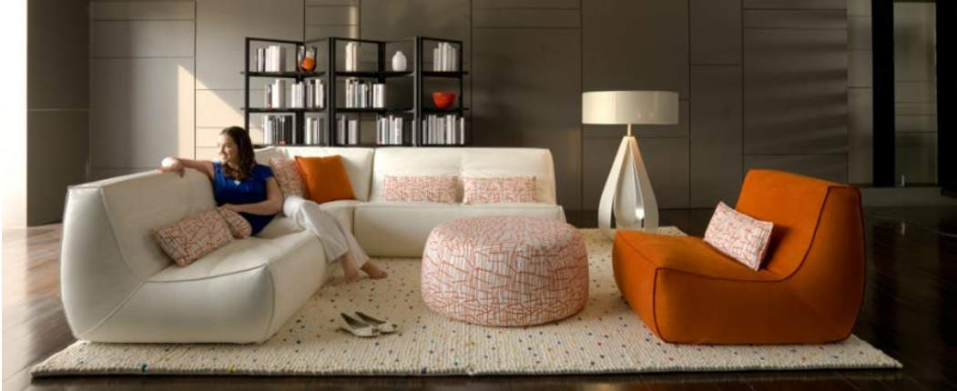
صورة رقم " 5 " توضح المذهب الاختزالي في التصميم من حيث استخدام العناصر الاساسية واهميه التركيز على استخدام اللون الاساسي " كامل التشبع "

ومن خلال تطبيق مبدأ الاختزال وسماته في التصميم يستطيع المصمم الداخلي التحكم في المساحات الداخلية للفراغ، وتحقيق كافة المتطلبات الوظيفية والجمالية بها من خلال البساطة في معالجة عناصر الفراغ الداخلي من ارضيات وحوائط وأسقف وذلك عن طريق الاختيار المناسب للألوان والاضاءة والخامات وعناصر الاثاث الداخلية وتكاملهم في تصميم يتسم بالجمال الشكلي والاختزال والقدرة على الأداء الوظيفي. كما ان دراسة التأثيرات الضوئية التي تسقط على كل من الفراغ واللون جزء اساسي من خبرة المصمم، فالضوء والحركة يعتبران في حد ذاتهما بمثابة ارضية لعملية التصميم كما موضح بالصورة رقم " 6 "، والضوء له اهمية كبيرة في تشكيل الفراغ الداخلي الاختزالي (1 - ص 95).